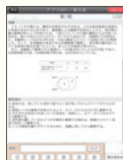
問題は6つの選択肢問題として出題されます。

※動作推奨は iOS7.1 です。教育デザイン室貸出の iPad は iOS7.1 になっています。