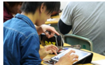
iPad で課題に取り組む様子

導入前に行なっていたアクティブ・ラーニングは、ライティングを発表するグループのみパソコン室に移動させグループワークを行い、結果をアップロードした後、講義室に戻ってくるという方法でした。そのため、教室