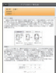
解答結果画面では各問題の解説と問題文のプレビューも表示されます。