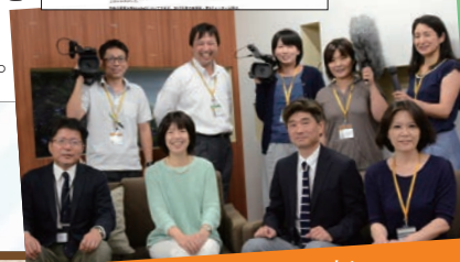
私たちがサポートします!