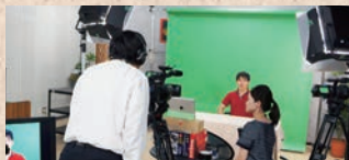
コンテンツの開発・制作支援

シラバスや講義資料などをもとに、資料の効果的な提示方法のご提案、教材のブラッシュアップ、講義の撮影・編集など、eラーニングコンテンツの制作支援を行います。