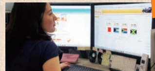
eラーニング運用サポート

シラバスや講義資料などをもとに、資料の効果的な提示方法のご提案、教材のブラッシュアップ、講義の撮影・編集など、eラーニングコンテンツの制作支援を行います。