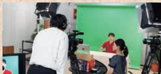
コンテンツの開発・制作支援

シラバスや講義資料などをもとに、資料の効果的な提示方法のご提案、教材のブラッシュアップ、講義の撮影・編集など、eラーニングコンテンツの制作支援を行います。